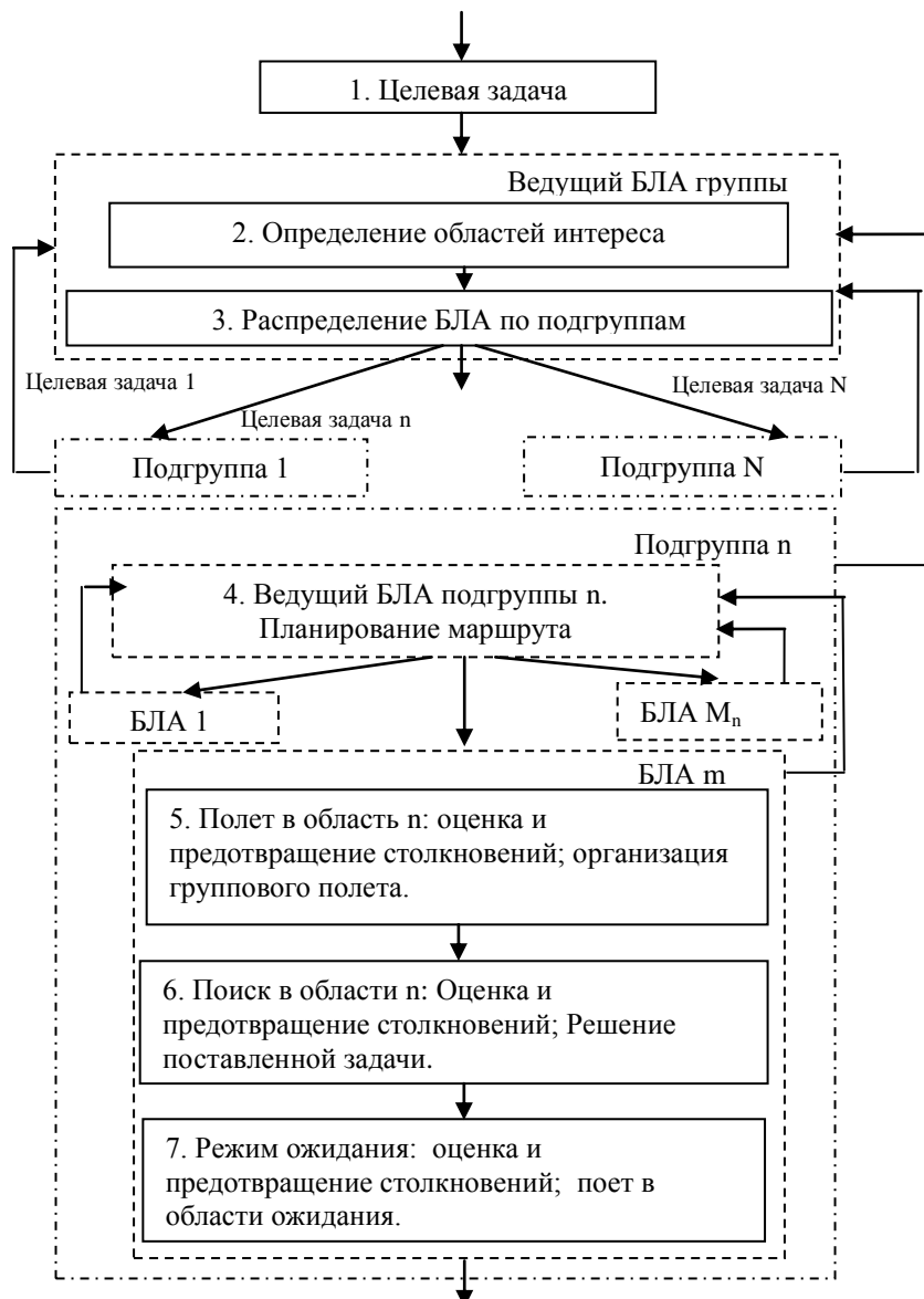
Рисунок 1. Структура алгоритма

Целевая задача, передаваемая ведущему группы БЛА, представляется в формализованном виде, позволяющем в бортовых вычислителях БЛА планировать и реализовать дальнейшие действия группы, подгрупп и отдельных БЛА.