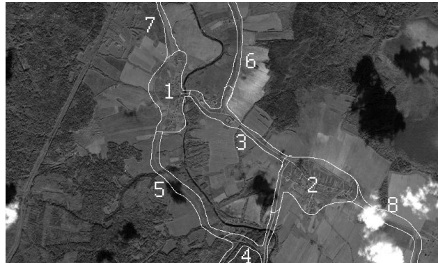
Рисунок 2. Выделенные области интереса.

В результате реализации данной процедуры, выделяются области возможного нахождения объекта (области интереса). Примеры выделенных областей интереса представлены на рисунке 2.