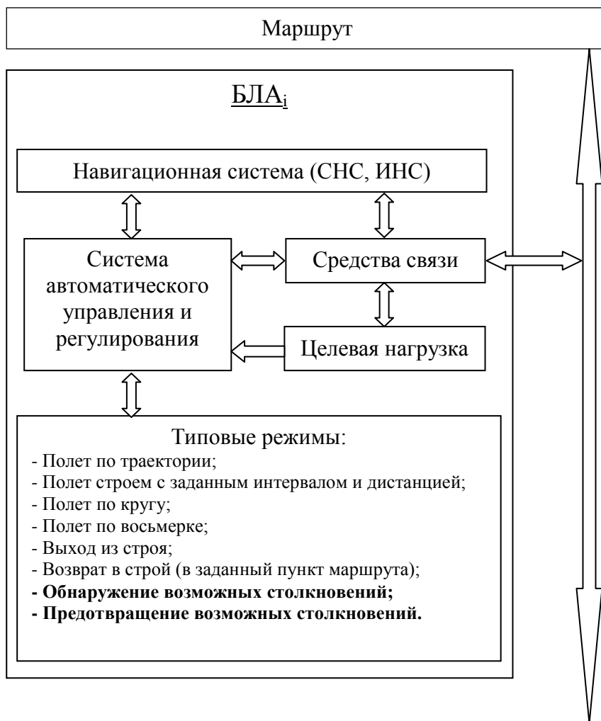
Рисунок 4. Структура бортового оборудования БЛА

Верхний блок, изображенный на рисунке 4, содержит информацию о маршруте группы, в которую входит i -ый БЛА. Эта информация доступна каждому БЛА из группы, а если функционируют несколько групп, то и БЛА из других групп.